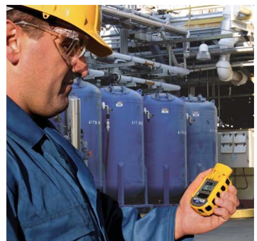
Überwachung der Belastung der Arbeiter mit ToxiRAE Pro PID in einem PVC-Werk